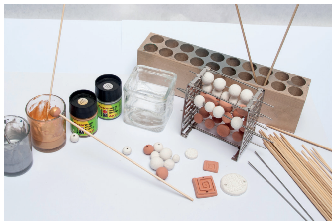
Kralen aan de houten stokjes rijgen, in de gewenste kleur verf dopen, laten drogen.